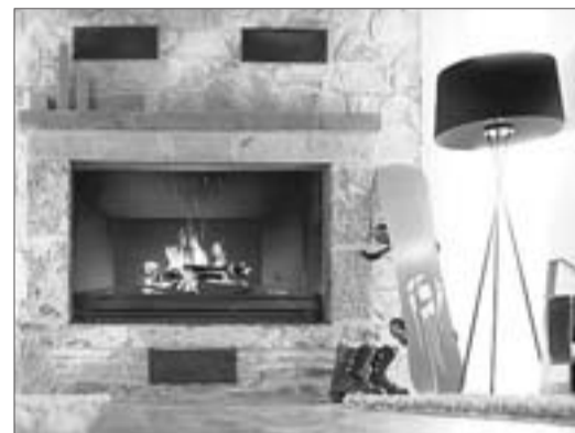
Chimenea en la recepción del Barceló Jaca Golf & Spa.