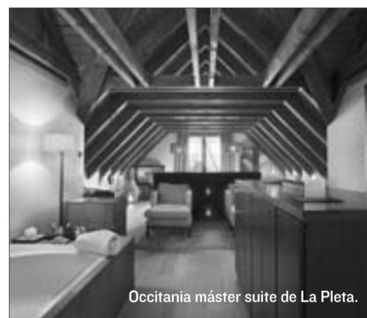
Occitania máster suite de La Pleta.