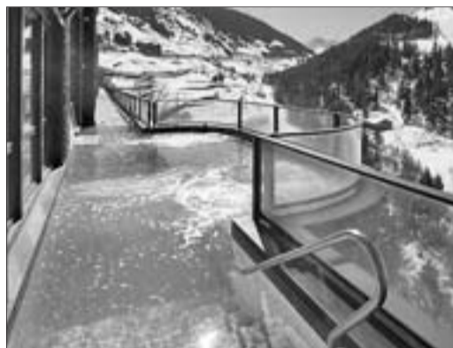
Hidromasaje exterior del Sport Hotel Hermitage.