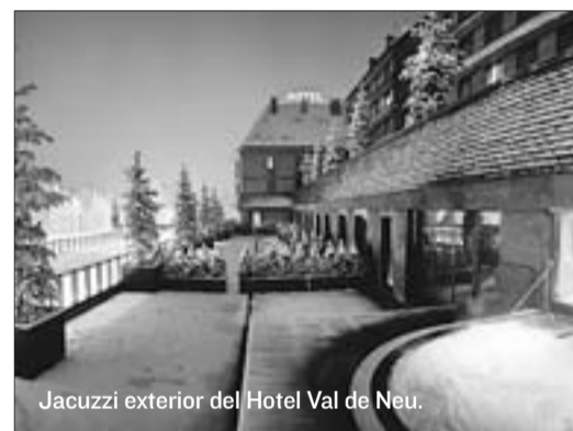
Jacuzzi exterior del Hotel Val de Neu.