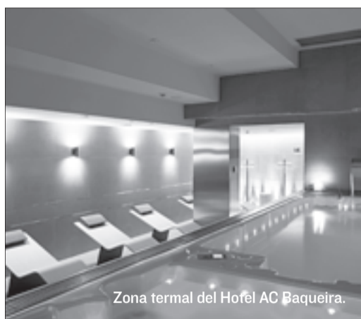
Zona termal del Hotel AC Baqueira.

Si un día se tiene menos ganas de esquiar, se puede probar una vuelo en globo aerostático. Para los intrépidos, lanzarse a la aventura gracias al heliesquí , que consiste en saltar desde un helicóptero y bajar esquizando por nieve virgen. Son propuestas de actividades del Sport Hotel Hermitage & Spa , en Soldeu (Andorra),