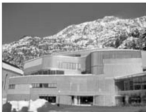
Exterior del Panticosa Resort, que esconde las Termas de Tiberio.