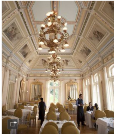
Restaurante de Las Caldas, en Oviedo.

» Dirección: avenida del Doctor Furest, 32. Caldes de Malavella, Girona. Teléfono: 972 47 00 00. Internet: www.balneariovichycatalan.com . Precio: desde 65 euros la habitación doble.