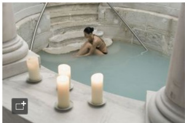
Baño termal en el balneario de Carratraca, en Málaga.

¿Qué vivieron entre estos estrechos muros la emperatriz Eugenia de Montijo, Lord Byron y Rainer Maria Rilke? Quién sabe, pero cada uno en su época se enamoró de este lugar y lo utilizó repetidas veces como refugio. El balneario estaba ya en malas condiciones cuando la propiedad de Villapadierna consideró oportuno invertir en su remodelación y