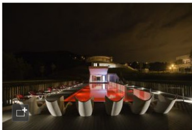
Piscina exterior ambientada en rojo del balneario Las Caldas, en Oviedo.

Es una histórica villa termal recuperada hace poco para el turismo de salud y deporte. Aquí se realizan, casi sin que uno lo pida, una prueba de esfuerzo, un diagnóstico de elasticidad muscular, una métrica de los niveles de resistencia física. No en vano el balneario se promueve como el Instituto de Vida Sana con un espacio ecotermal denominado Aquaxana, que en bable quiere decir