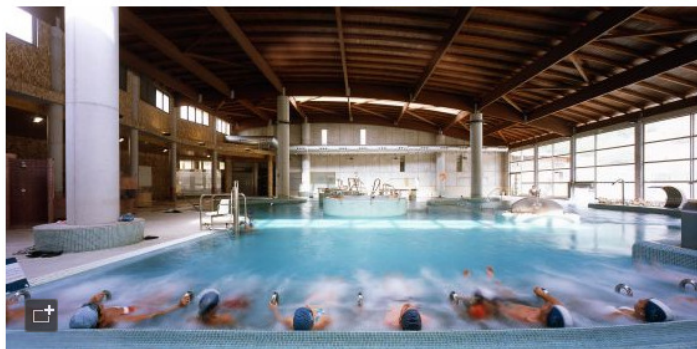
Piscina del espacio Termalium del balneario de Archena (Murcia).

De moda en todo el mundo, la palabra spa nos traslada a una experiencia sensorial con poderes terapéuticos y escenografía lúdica. En España, el balnearismo ha sido una actividad muy anterior a la fenomenología del turismo, que enraíza con la tradición termal romana y el culto musulmán al agua. Ofrecemos 10 ejemplos.