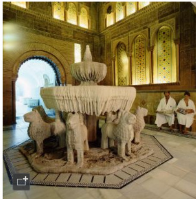
Galería alhambrista del balneario de Archena, en Murcia.

En la Edad Media fueron los Caballeros de Santiago y la orden de San Juan de Jerusalén quienes se curaban aquí de sus heridas de guerra. El apogeo de este balneario sucede durante el siglo XIX hasta mediados del siglo XX, cuando su sabor clásico no satisface a las nuevas clases medias, embrujadas por el poder de otras aguas murcianas, las mediterráneas de Mazarrón o San Pedro del Pinatar. Pese a ello, Archena ofrece tratamientos muy efectivos contra el reuma y otras enfermedades