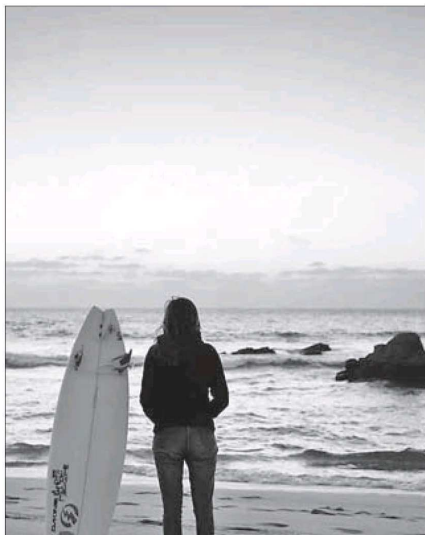
Surfista en la playa de Sagres (Portugal).