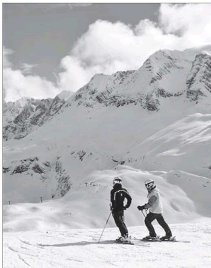
Dos esquiadores en las pistas de esquí de Panticosa.